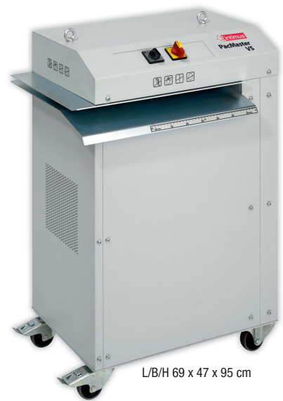
L/B/H 69 x 47 x 95 cm

Alle Unternehmen, die Pakete versenden oder erhalten, werden förmlich mit Kartons aus Wellpappe überschwemmt. Dieses Verpackungsmaterial ist praktisch und stabil – aber was geschieht, wenn es nicht mehr verwendet wird? Die Shredder für Verpackungsmaterial sorgen für ein einzigartiges Wellpappe-Recycling: Sie verwandeln gebrauchte Wellpappekartons in wertvolles Füllmaterial und Verpackungspolster. Das anfallende Füllmaterial gewährleistet zuverlässigen Schutz während des Versands – und das sogar bei sensiblen und schweren Waren. Für jede Organisation, die regelmäßig Pakete erhält und verschickt, zahlen sich diese praktischen Shredder für Füllmaterial sehr schnell aus. Das für intimus® patentierte, einzigartige Schneidesystem verwandelt Kartons in dickes, stoßabsorbierendes Verpackungsmaterial. Je nachdem, wie flexibel Ihr Verpackungsmaterial sein muss, können bis zu drei Kartonschichten gleichzeitig verarbeitet werden.