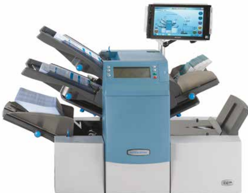
Die Tablet PC Lösung ergänzt die DI380 wie auch DI425.